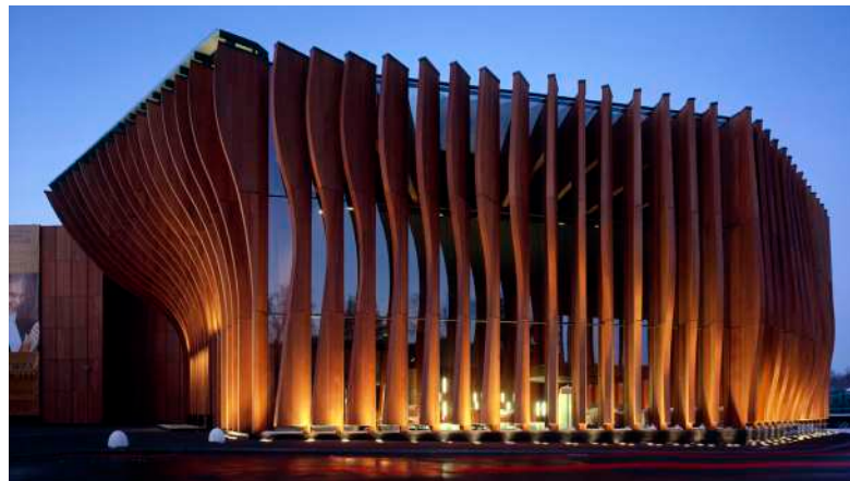
Театр Меркури. Концертный зал (Москва, Россия) / Меганом