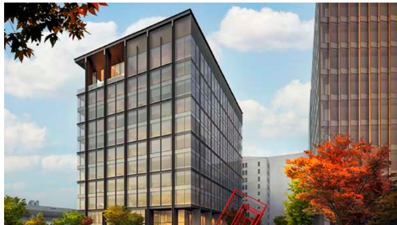
Аркус 3, 4. Офисный комплекс класса А (Москва, Россия) / AB Development