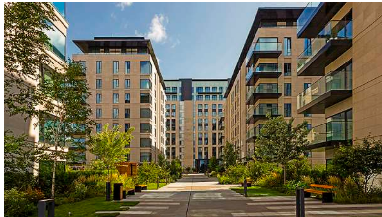
Вишневый сад. Элитный жилой комплекс (Москва, Россия) / AB Development

— девелоперская компания, более 14 лет работающая в Москве и Санкт-Петербурге и завоевавшая репутацию лидера в сегменте элитной жилой недвижимости. Компания реализовала 15 масштабных девелоперских проектов с общим бюджетом 1 млрд долларов. Проекты удостоились множества престижных премий — CRE Awards, Civic Trust Awards, RIBA International Awards и других, символизирующих международное признание.